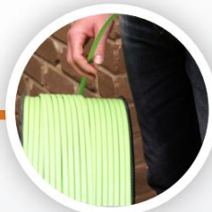
Fibre en cours de test